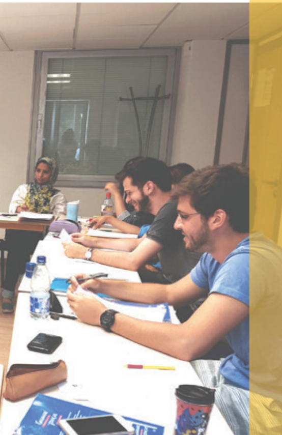
Training for teachers of french